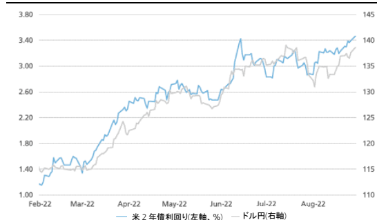
図表 1:ドル円は米2年国債利回りの急上昇に追隨 ドル円レートと米2年国債利回り

リフィニティブ、マクロボンド、UBS算出。*購買力平価(PPP)はそれ自体予測ではなく、UBSが算出した為替レートの長期均衡値。トレンド外挿法による均衡為替レート(TEEER)はPPPの今後3年の予測値。