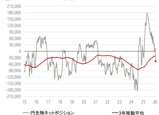
図表2: 円の投機的ポジションはネットショートに転じた 週次データ、単位: 取引枚数