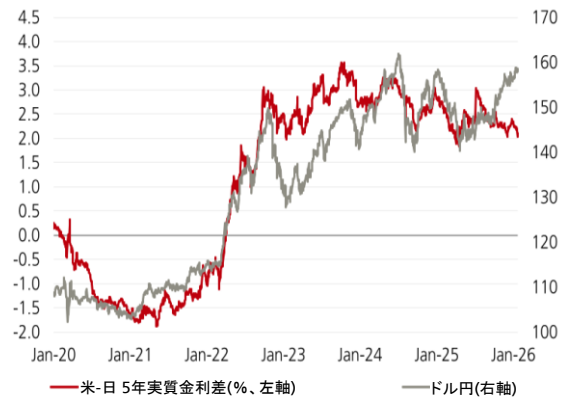
図表1: ドル円は財政懸念を織り込み上昇した 米-日 5年実質金利差(%), ドル円